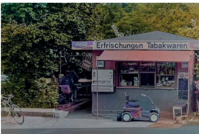
Trinkhalle Bathke Am Müsendrei (nachcoleriert)

Noch heute gibt es in Hüttenau zwei beliebte Kioske an der Marxstraße 41 und 63. An anderen Orten erinnern jedoch nur noch un- oder umgenutzte Gebäude an frühere Trinkhallen: etwa am Wendehammer auf dem Haidchen, Zimmermanns Büdchen an der Käthe-Kollwitz-Straße oder der frühere Außer-Haus-Verkauf an der unteren Marxstraße.